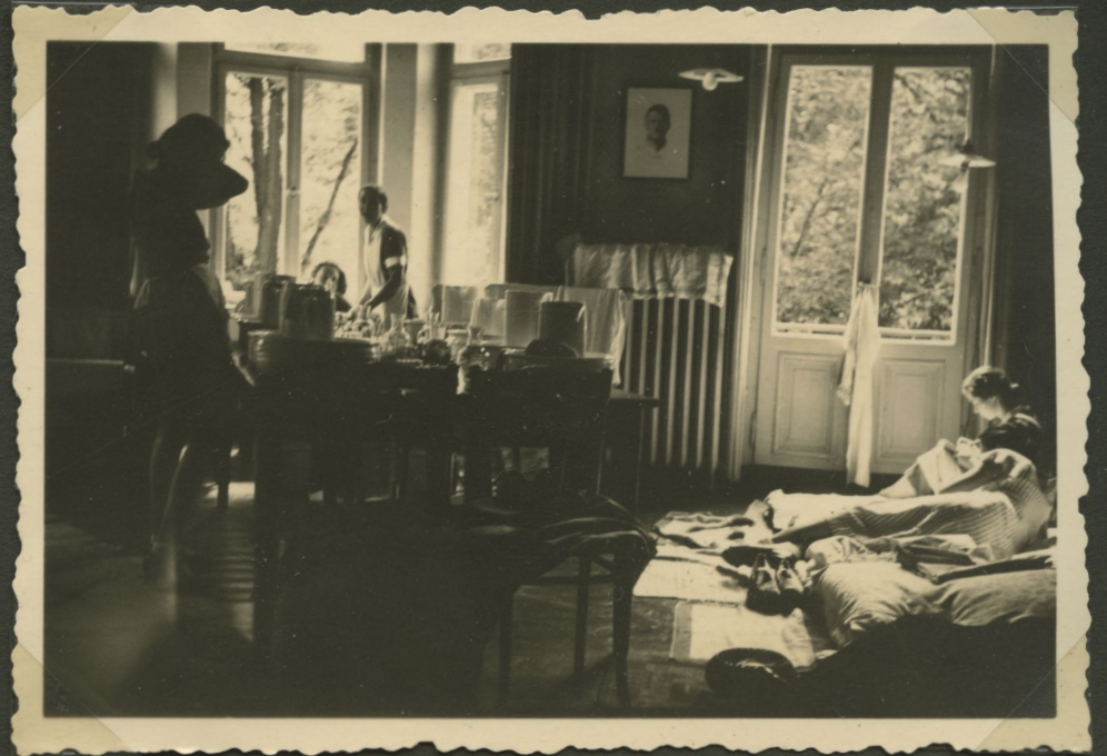
»Paretz wird geräumt man schläft auf Matratzen im oberen Schulzimmer«