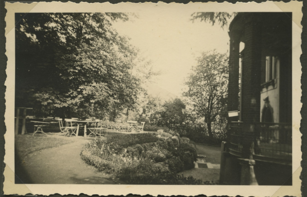
»Baumgarten vor dem Luisenhaus«