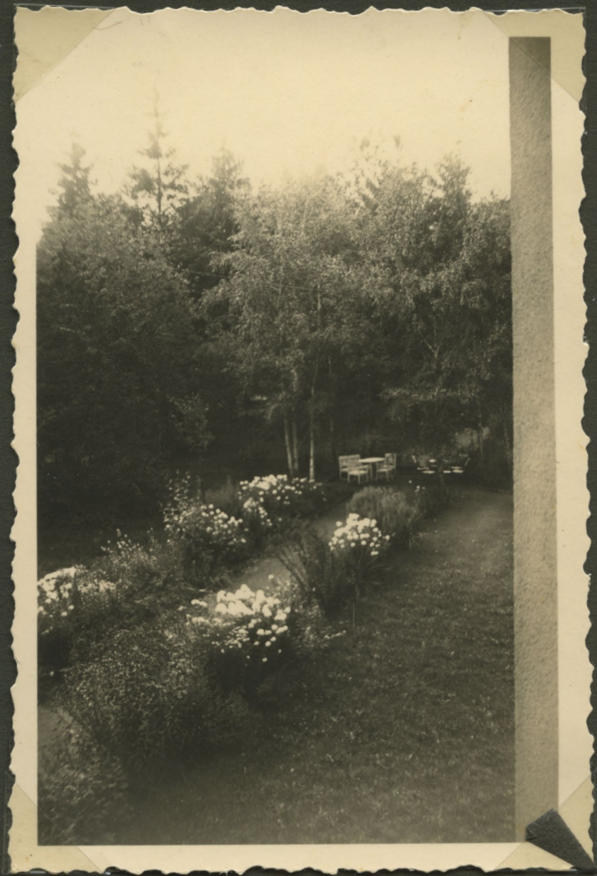
»Laubengang mit Birkenplatz vom oberen Paretz Balkon«