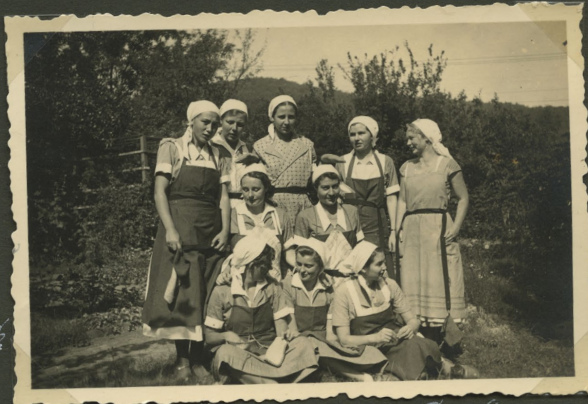
Die Kochgruppe Nr. 4 Die Abis.

»Sport auf dem Truppenübungsplatz der Dönche«