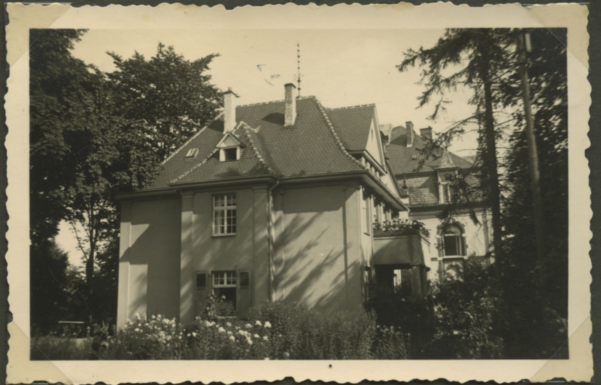
»Paretz von Westen«