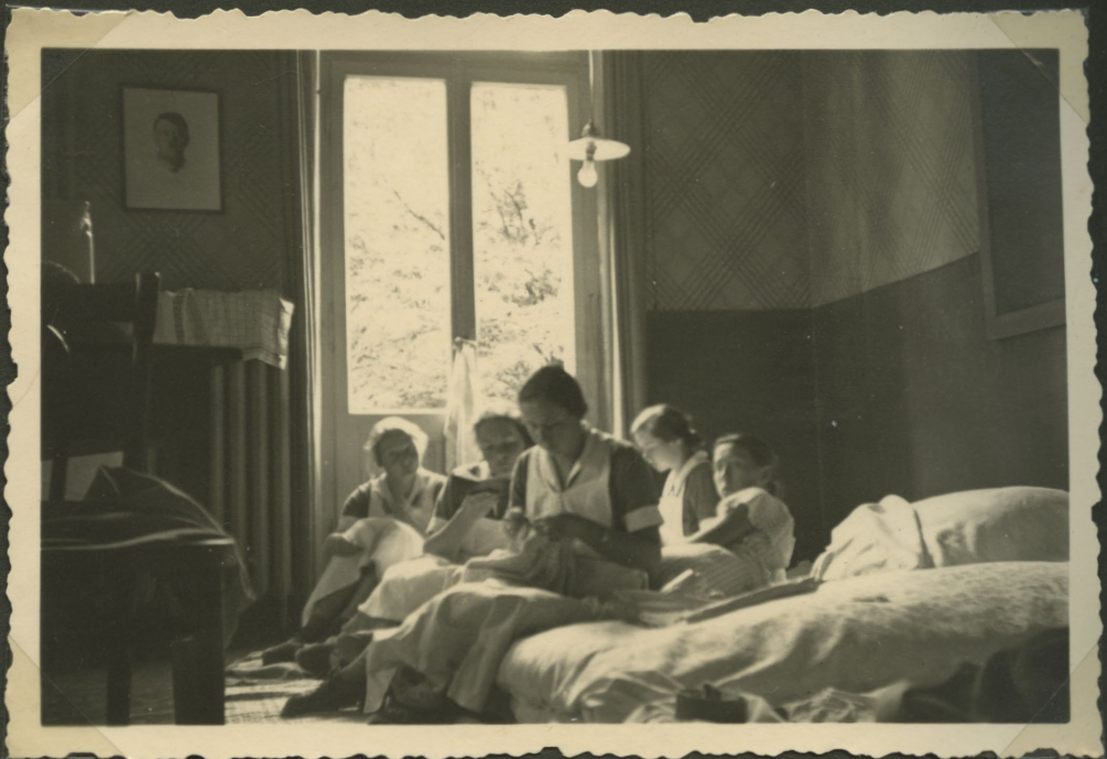
Paretz wird geräumt man pflegt auf Matratzen im oberen Schulzimmer.