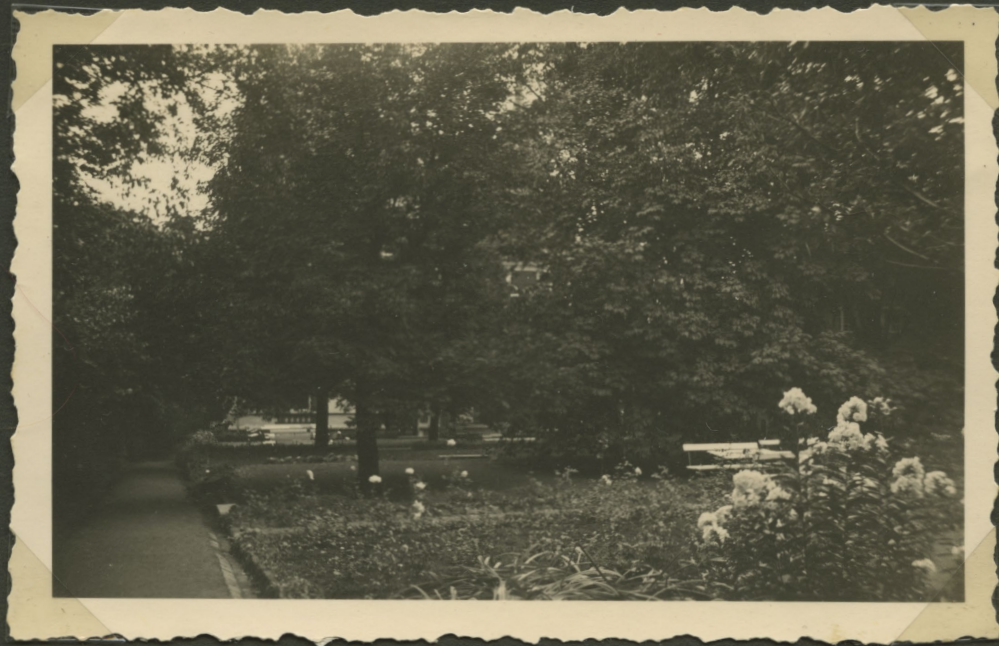
»Eingang von der Straßenbahn aus«