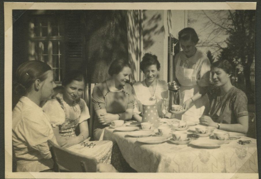
»Der 1. Sonntagskaffee unter der Kastanie«