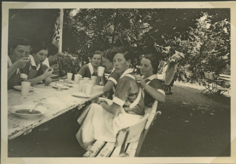
Frühstück 1/4 nach 10 Uhr