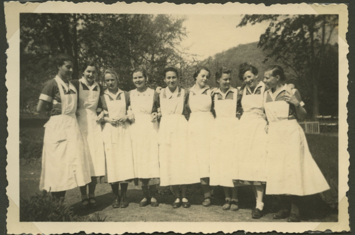
»Die 10 Abis im Garten«