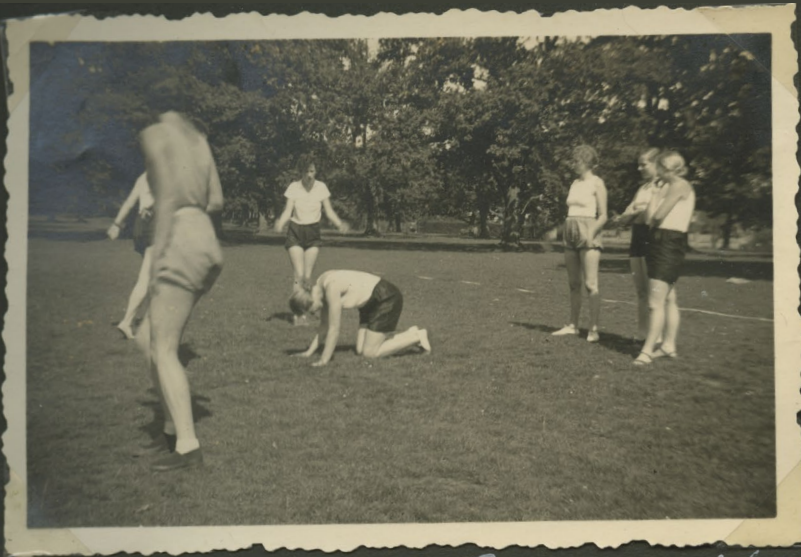
Sport auf dem Truppenübungsplatz bei Dönche